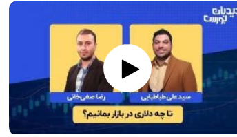
تا چه دلاری در بورس بمانیم؟