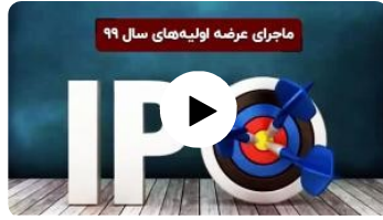
ماجرای عرضه اولیه های سال ۹۹