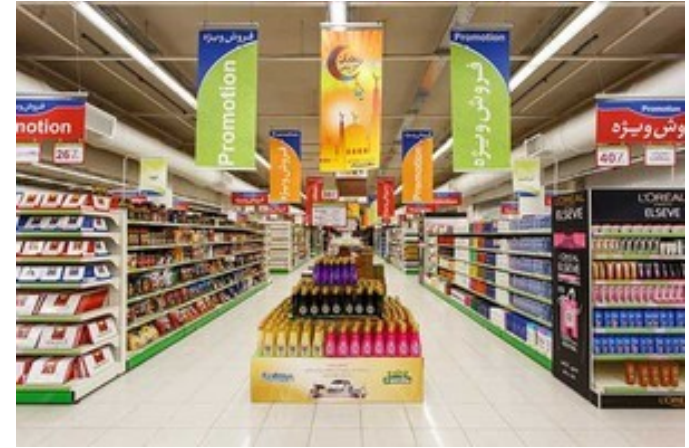
سوپر مارکت اینترنتی آی لایف * تحویل درب منزل در تهران *