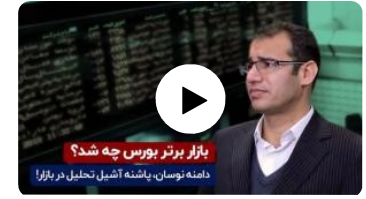
بازار برتر بورس چه شد؟

شماره روزنامه: ۵۰۹۳ تاریخ چاپ: ۱۳۹۹/۱۱/۶ شماره خبر: ۳۷۳۴۲۷۵