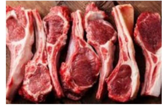
این مسابقه رو شرکت کن، یک سال گوشت نخرا!

از این منفی ها خسته نشدی؟! کسب و کار خودتو راه بنداز