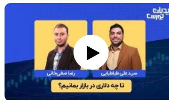
تا چه دلاری در بورس بمانیم؟