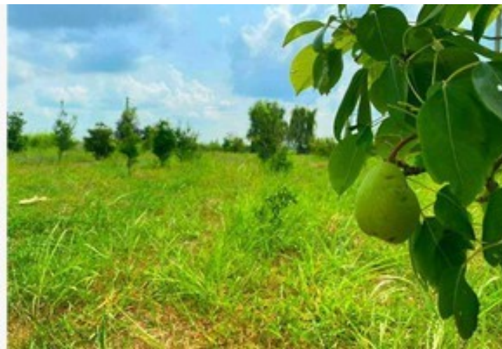
فروش زمین های آینده دار در شمال برای سرمایه گذاری با کمترین قیمت