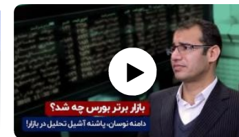
بازار برتر بورس چه شد؟

شماره روزنامه: ۵۰۹۳ تاریخ چاپ: ۱۳۹۹/۱۱/۶ شماره خبر: ۳۷۳۴۲۷۷