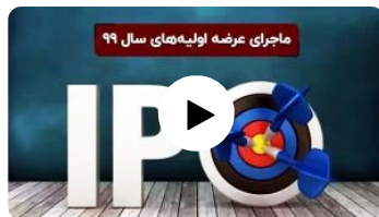
ماجرای عرضه اولیه‌های سال ۹۹