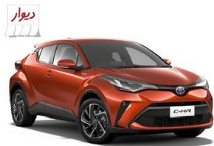
خودرو تویوتا C-HR هیبرید رو از دیوار بخر!