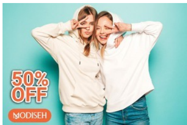
لباس خود را با ۵۰٪ تخفیف بخرید