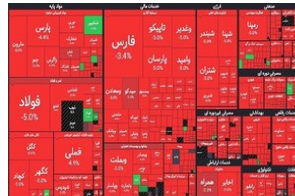
از این منفی ها خسته نشدی؟! کسب و کار خودتو راه بنداز