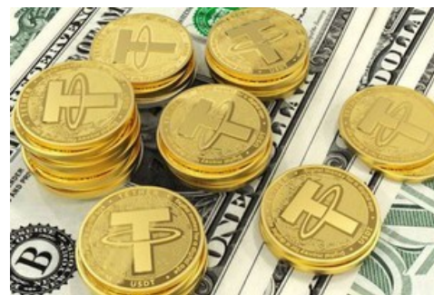
آموزش رایگان خرید قانونی تتر (دلار دیجیتال)!