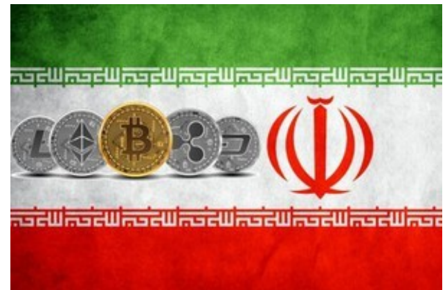
آموزش رایگان و تصویری خرید قانونی بیت‌کوین در ۱۰ دقیقه!